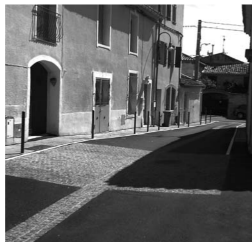
Rue père Picard

pour terminer le chantier. Le résultat est séduisant ! Nous souhaitons pouvoir rénover ainsi, petit à petit, l'ensemble des ruelles du centre village pour leur donner le cachet qu'elles méritent.