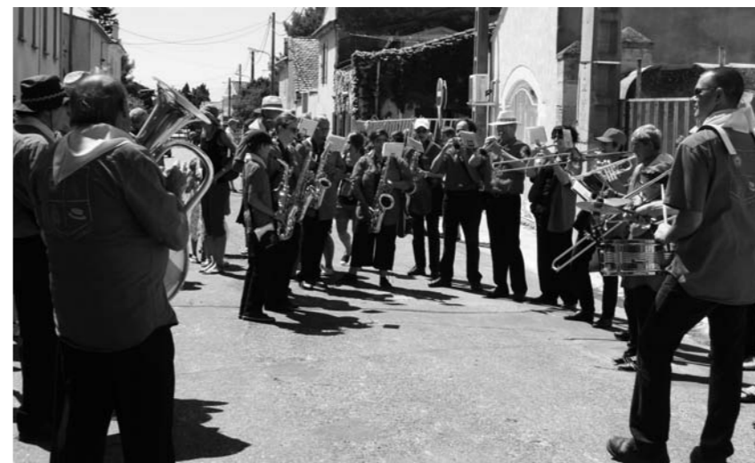
Pena de la Vaunage

par l'orchestre EVASION bien connu et toujours très apprécié. Le lundi place au déjeuner et jeux pour enfants dans la cour de l'école puis à l'abrivado animé par le groupe CARTOON SHOW... (suite p.8)