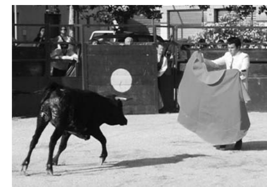
Graines de Torero