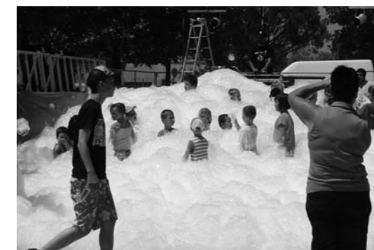
L'apéro-mousse toujours aussi surprenant