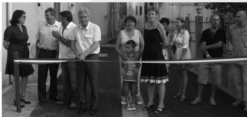
Inauguration des rues père Picard et Pasteur