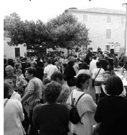
Au fond "l'orchestre Evasion"

Pour la quatrième année, Saint-Gervasy a fêté la musique.