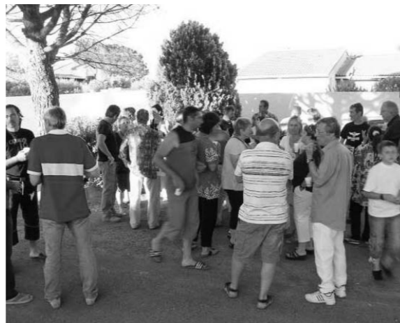
Une rencontre dans la joie et la bonne humeur

des "tables et chaises" et vous donnons tous rendez-vous l'année prochaine.