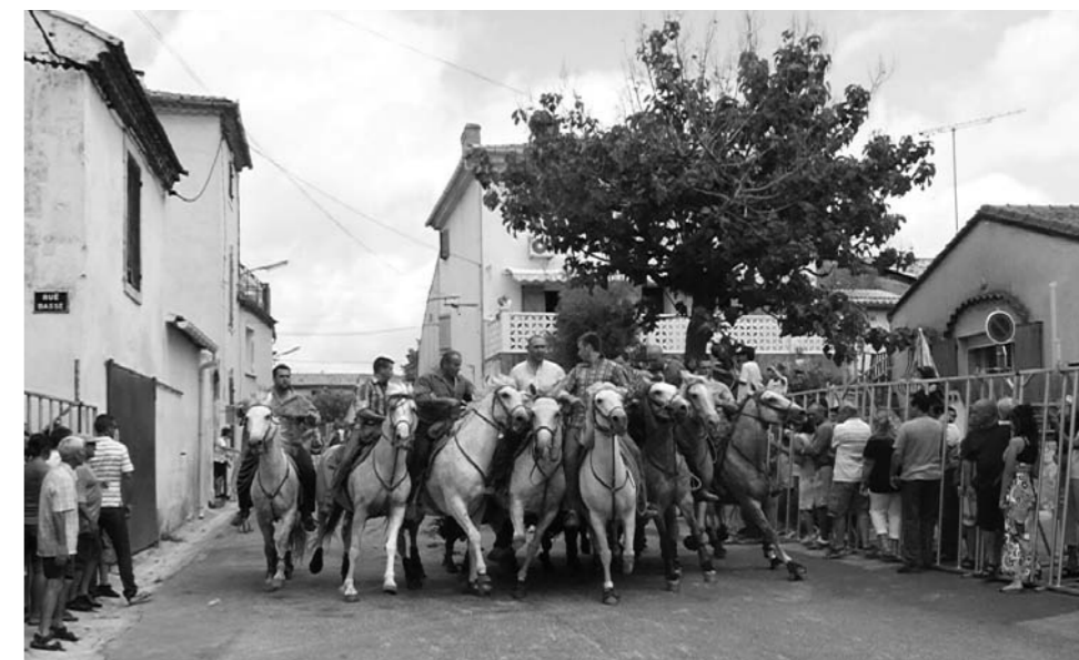
Abrivado Avenue Frédéric Mistral

L'après-midi le concours de boules rassemble les amateurs de pétanque avant "graines de Toreros". La soirée est animée