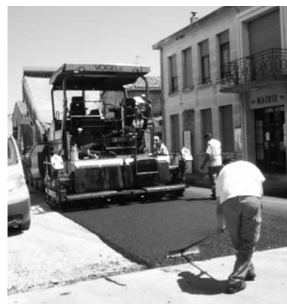
Goudronnage des rues

C'est l'entreprise CREGUT qui en a été chargée. Elle a d'abord retiré le revêtement existant, construit des caniveaux en pavés de pierre et enfin posé le bitume